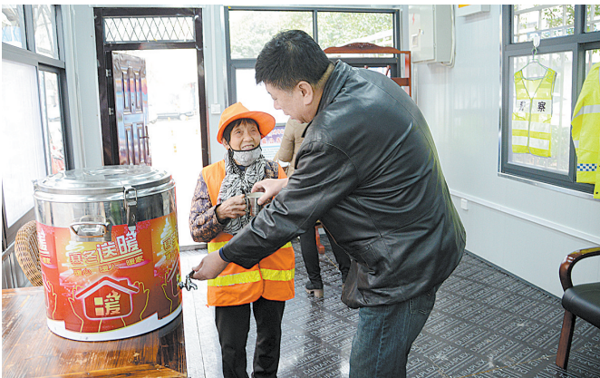
昨天上午,交通安全劝导站志愿者为环卫工程玲送上热腾腾的豆浆。本报记者 张鹏 摄

付嘉说,现在这个交通安全劝导站正在招募志愿者,工作内容是在早、中、晚高峰时段配合交警劝阻及纠正违反交通规则的不文明行为,教育引导市民文明行路,热心搀扶病、残、老人过马路等。如果市民有爱心有时间,可以前来报名参加此项志愿活动。