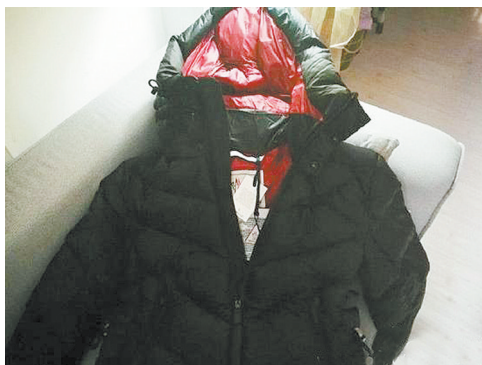
▲那件惹争议的羽绒服