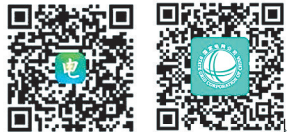
“电e宝”二维码 “掌上电力”二维码

“掌上电力”基本操作:(1)从右上角“登录”进入“立即注册”,将提示信息完善后进行登录;(2)点击“我的”进行用户号绑定。查询密码:095598或111111。