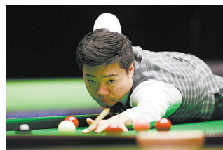
11月27日,丁俊晖在比赛中。当日,在英国约克举行的2016斯诺克英国锦标赛第二轮比赛中,中国选手丁俊晖以6:2战胜苏格兰选手穆尔,进入32强。

在今年的国际赛事结束后,国羽将进入新的奥运周期的第一个冬训期,这将是这批小将们敲定组合、开启未来的重要阶段。而明年初,新的奥运周期开始,这批小将的表现非常值得期待。(北青)