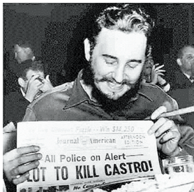
卡斯特罗展示美国企图刺杀他的新闻报道。(资料图)

在敌对者眼中，他是“暴君”和“独裁者”，而在古巴人心中，他是“领袖”和“救星”。菲德尔成就了古巴的社会主义政权，一生中逃过600多次暗杀，并以一己之力与超级大国美国对抗了半个世纪。如今，拉美雄鹰远去，而他的一生，已然成就一段传奇。