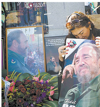
11月26日，哈瓦那市民手持菲德尔·卡斯特罗海报参加悼念活动。(扬城)

醒着的人们开始将这个噩耗传递给家人、邻居和朋友。夜幕笼罩的哈瓦那街头，酒吧、夜总会提前打烊，以示对菲德尔·卡斯特罗的尊重。许多路人沉浸在惊愕和悲痛中，沉默不语，眼泪不自觉地流下，因为这位他们亲切称为“菲德尔”的长者是他们最敬爱的人。