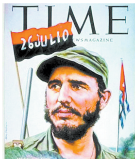
菲德尔·卡斯特罗登上《时代》封面。(资料图)