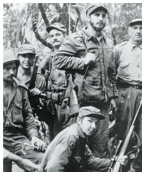
这是劳尔·卡斯特罗(前)、菲德尔·卡斯特罗(右二)和切·格瓦拉(左二)等1958年开展游击战争时拍摄的照片。