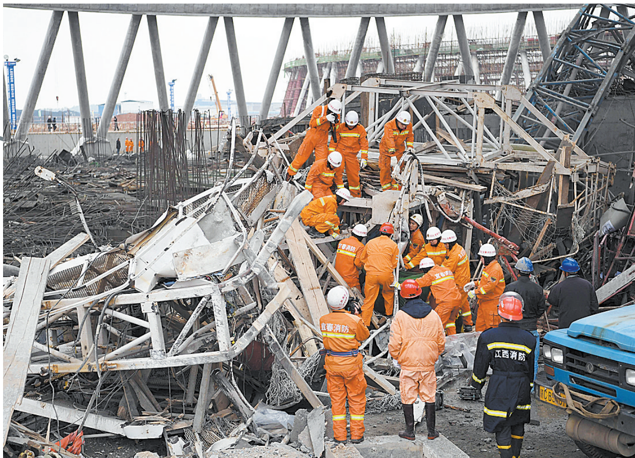
昨天,救援人员在事故现场工作。

据江西省丰城市安监局消息,昨天7时左右,江西省宜春市丰城电厂三期扩建工程D标段冷却塔平桥吊倒塌,造成上面未班混凝土通道坍塌。事故发生时,施工单位正在进行零点班和早班交接,初步确认现场共有70人。截至昨天20时,丰城电厂“11·24”事故现场搜救基本结束,事故造成67人死亡,3人受伤,其中1人正在抢救。死亡人员主要来自河北、湖北两省,善后工作正在紧张进行中。