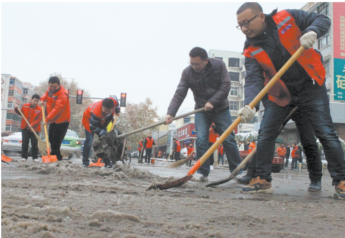
昨天，市区建设路与光明路交叉口，市城管处的职工在清扫路面的积雪。