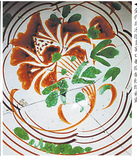
►金代北方很多窑口都烧制红绿彩瓷