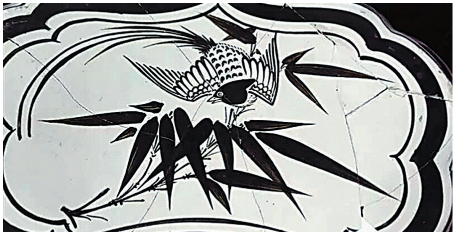
▲从瓷片上的绘画可以看到当年绘画的方式、使用的颜料、工匠的手法与风格