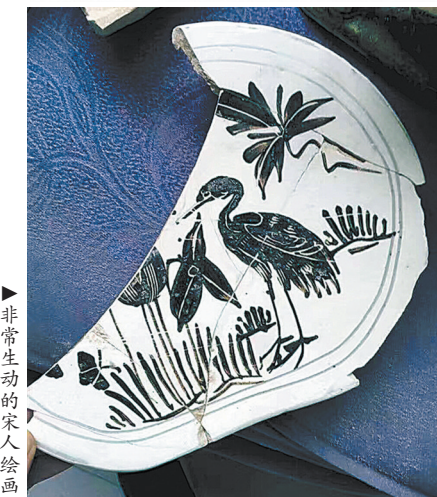
►非常生动的宋人绘画