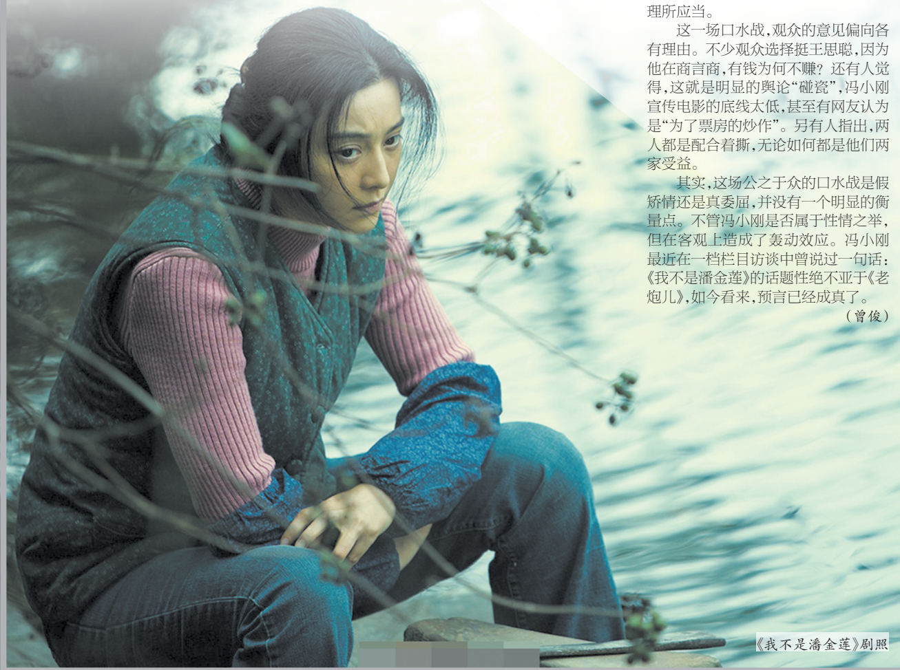
《我不是潘金莲》剧照