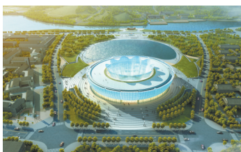
中国汝瓷博物馆鸟瞰

频道播出，《雨过天青》汝瓷再次引起世人瞩目。 工传世——汝瓷大师朱文立专题片在央视新闻月5日晚上6时30分，大型纪录片《大国工匠》大立仔细端详手中古瓷片的画面徐徐展开——800年的珍品瓷重现于世。一段背景音乐后，朱文立信仰，朱文立始终苦苦寻觅，呕心沥血，终使绝迹只在历史上惊鸿一现。带着对复烧汝瓷的执着，「汝瓷被视为中国瓷器烧制技艺的巅峰，却