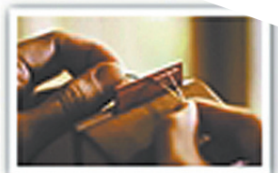
很多网友在“手工客”平台上展示作品