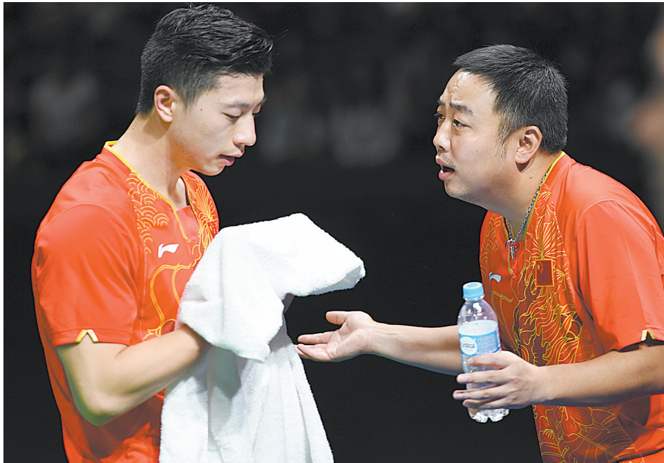
刘国梁从国家队正式退役后,于2003年出任男队教研组组长和男队主教练,2013年出任国