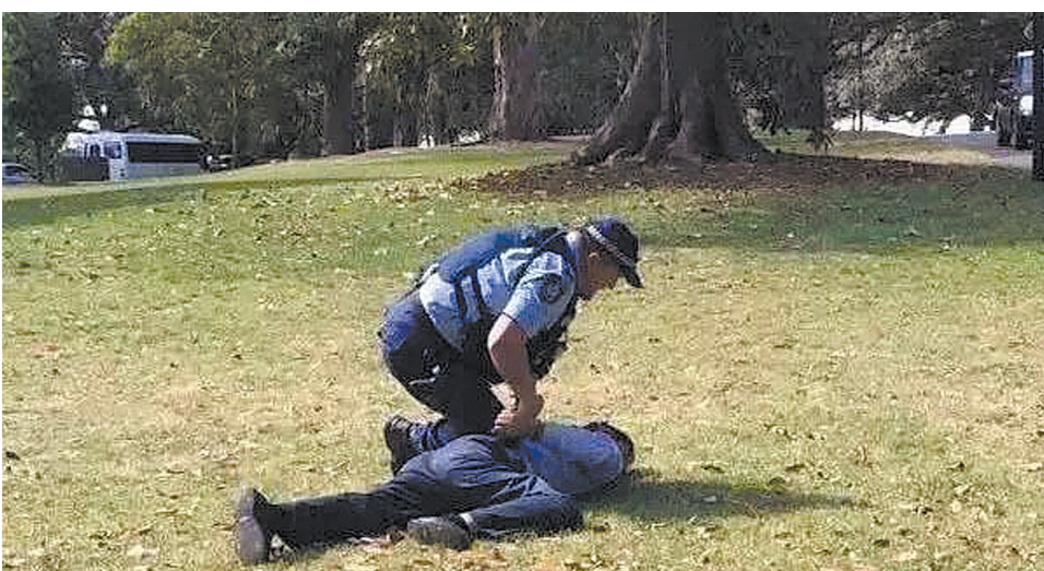
澳大利亚警察抓捕一名中国游客

该微博还配上了两张疑似国外警察抓捕两名华人的照片以及一张网友对话截图,内容为:“刚才有两个温州客人在悉尼草坪上拉屎,让警察看见了。警察追他们,他们提着裤子跑。他们恼羞成怒,要打警察。警察一个过肩摔,把一个男的摔地上骨折了。”