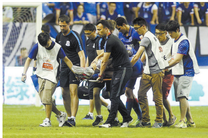
登巴巴被工作人员抬下场。