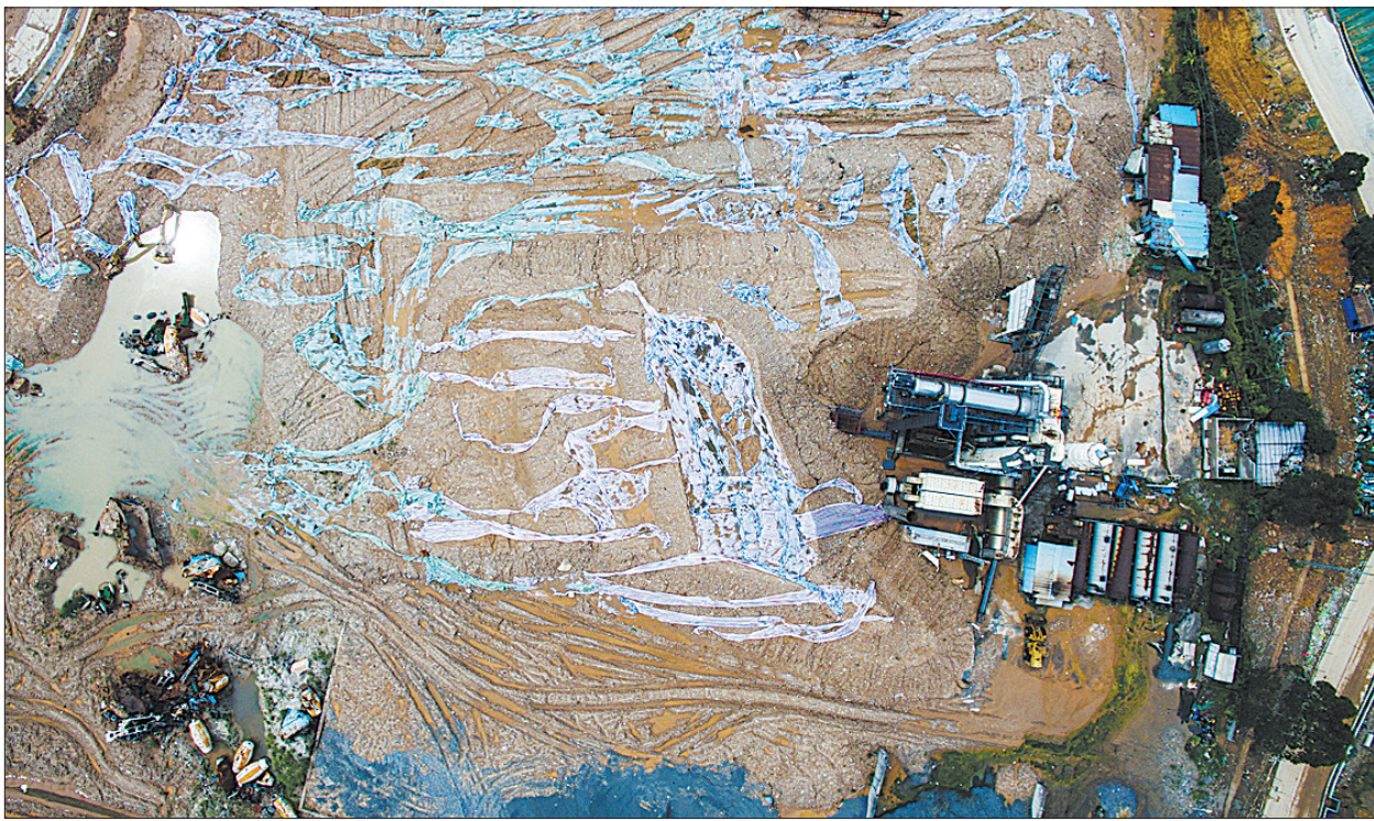
图为深圳光明新区渣土受纳场“12·20”特别重大滑坡事故事发地(6月16日摄)。