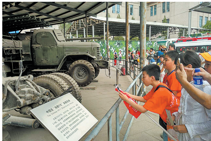
小记者参观军事博物馆