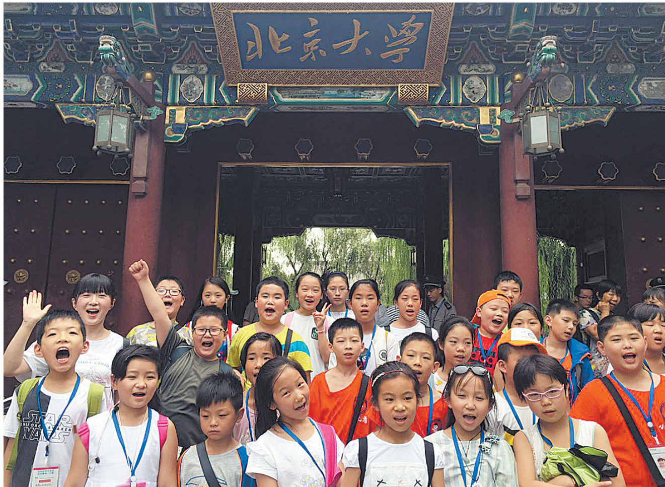
小记者在北京大学西门前合影