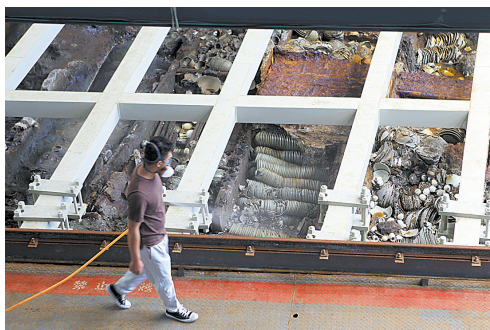
考古人员在对“南海一号”古沉船进行最后的清理。