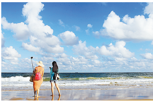
迷人的十里海滩, 让天南地北的游客流连忘返。