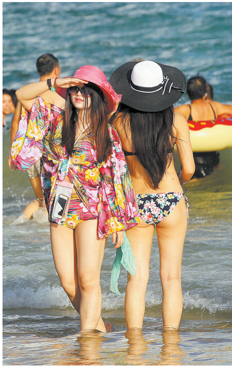
海滨逐浪, 丽影闪动。

有着“全国十大美丽海岛”之称的海陵岛,位于浩瀚的南海之滨、广东省阳江市的西南端,是古代海上丝绸之路的重要驿站,更是郑和七下西洋的补给站。2007年在这里打捞出海的“南海一号”南宋古沉船,成为海上丝路的最好物证。湛蓝无垠的海水,为海陵岛洗出了绵延十里的细沙海滩;喀斯特地貌,又给海陵岛雕出了童话世界般的溶洞……海陵岛,这颗海上古丝路的明珠,如今依然放射出迷人的光芒。