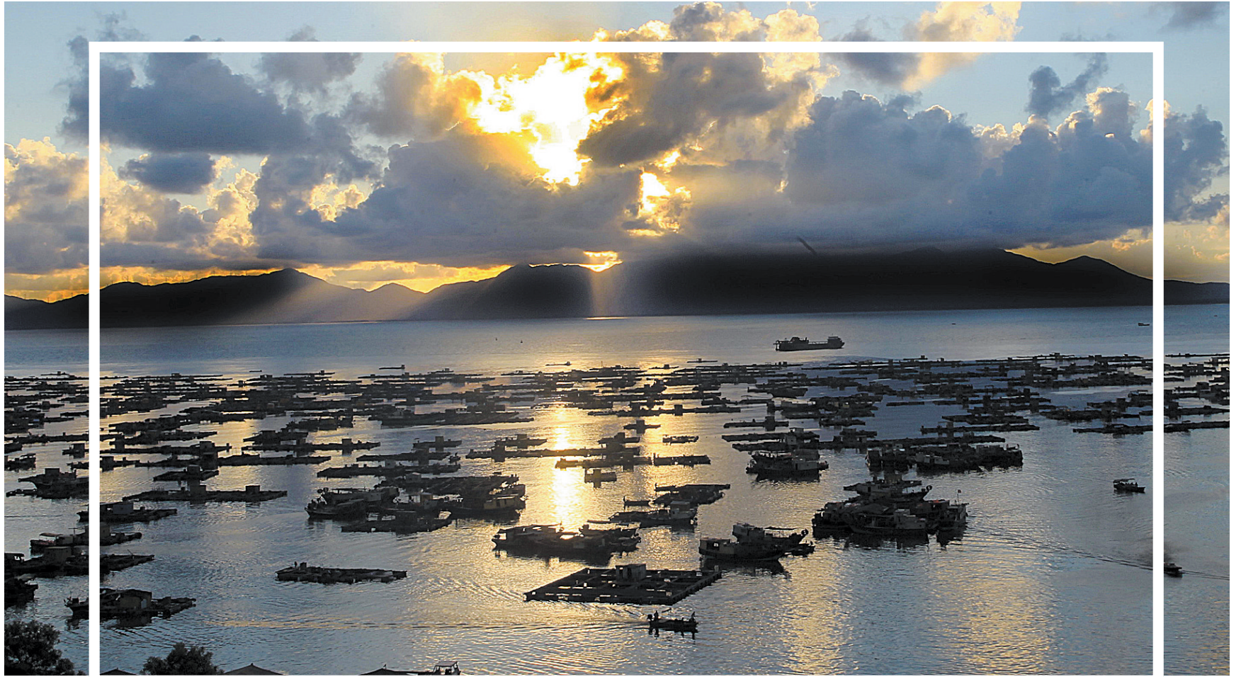
落日余晖照耀下的渔排, 颇为壮观。