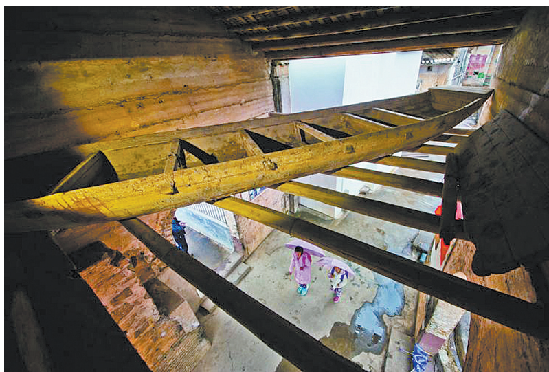
林寨独有的防洪设计——“船艇上楼梯”

角，加建高出房屋一至二层的阁楼，其形制和功能都如同炮楼一般。高耸的阁楼之间，由回廊相连接，在整个建筑里可以上下贯穿，四通八达，既可居高临下对房屋四周进行监护与瞭望，又可对入侵者进行狙击。