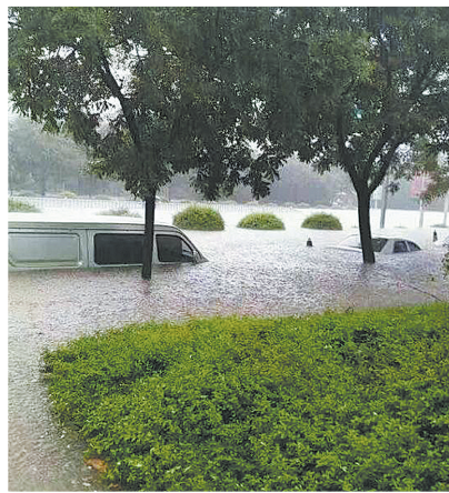
▲7月9日,在新乡市街头,雨水几乎没过车辆。