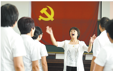
6月30日,在河北省大厂回族自治县大厂二中举办的“巡回宣讲堂”上,参加培训的党员教师合唱歌曲《没有共产党就没有新中国》。