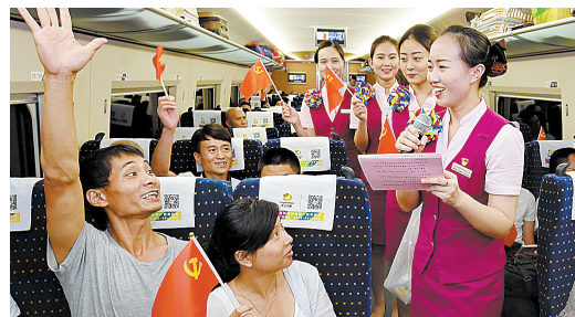
6月30日,福州客运段党员和入党积极分子在车厢里进行党史知识竞答。