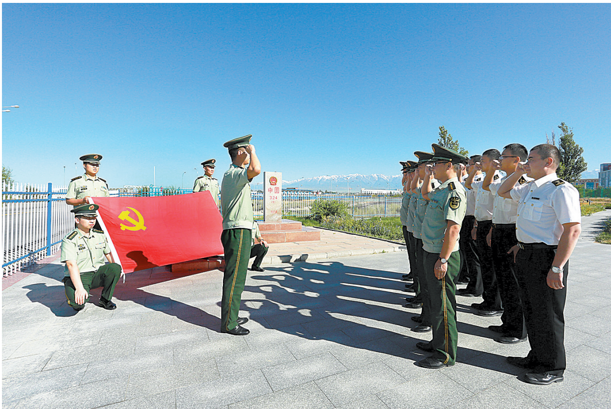
6月29日,来自霍尔果斯边检站、霍尔果斯海关、霍尔果斯国家检验检疫局的一线执勤党员在324号界碑前面对党旗宣誓。