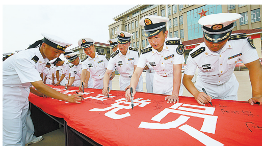
6月30日,海军东海舰队某护卫舰大队官兵在“传承海上铁人精神,争当优秀共产党员”横幅上签名。