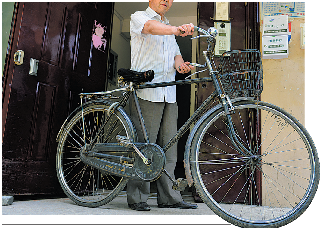
□本报记者 牛超/文

自行车是上世纪中期我国最流行的交通工具。能骑上一辆28自行车在大街小巷撒下一串“丁零零”，是当时很多人的梦想。很多人对于拥有第一辆自行车的记忆，相信比现在拥有一辆汽车更深刻。然而这个曾经集时尚、奢侈、便利、物流等形容词于一体的宠儿，最终被时间打败，被电动车、摩托车、轿车或者是更轻便的小自行车所替代，渐渐从人们的视野中消失。