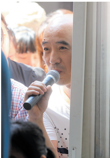
一位站在窗外听讲座的家长隔窗咨询

另外,如果你打算考研,什么专业更合适,我个人意见是基础专业会更好。比如你学数学,今后计算机、金融、经济都是不受影响的。另外,研究生导师也喜欢学数学的人