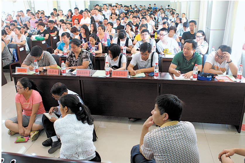
会议室里,一位难求。众多家长和考生或站立,或席地而坐听讲座。