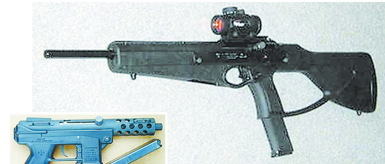
上为科伦拜校园血案中枪手曾使用的Hi-Point半自动卡宾枪枪型；左为该枪击案中枪手使用的TEC-DC9自动手枪枪型。