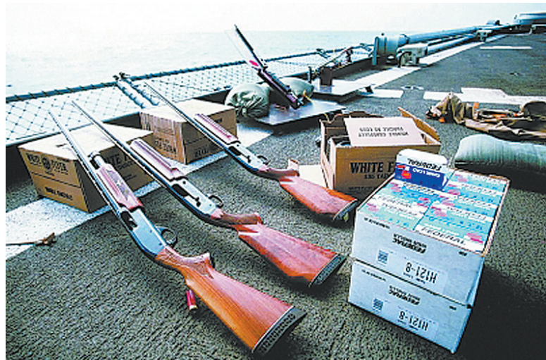
雷明顿-M870霰弹枪，《蝙蝠侠前传3——黑暗骑士崛起》首映仪式血案中枪手曾使用该型号枪支。