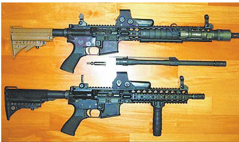
民间修改的各种AR-15突击步枪