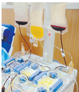
袋中黄色液体为血小板

有一种血液“金黄色”，有一种献血叫献“血小板”。平时，我们大家熟知的献血方式叫“捐献全血”。除此之外，还有“成分献血”。顾名思义，成分献血就是捐献血液中的某一成分，也称为成分单采。目前几乎所有血液成分都可以通过单采采集，如单采红细胞、单采血小板、单采血浆、单采粒细胞、单采外周血干细胞等。当下国内以单采血小板最为普遍。在发达国家和国内部分地区，单采血小板（机采血小板）已经被广大无偿献血者普遍接受，是一种安全、有效的献血方式