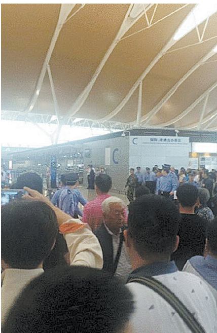
以上图片来自网友微博微信