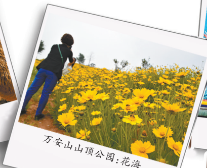
万安山山顶公园:花海