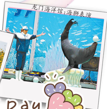
龙门海洋馆:海狮表演