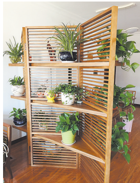
图(3)图(4):微友“晴天娃娃”家中照片。