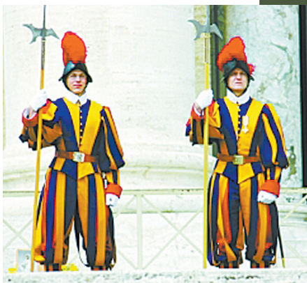
瑞士近卫队军服充满文艺复兴风格

兵“延伸”的腿,甚至可以说是“战友”。什么山沟、沙窝、沼泽地,车进不去的地方,骆驼都能进去;军车会坏,可骆驼7天7夜不吃不喝照样走得稳稳当当。而且骆驼的鼻子对水源特别敏感,几公里之外的水源都能闻到。有几次边防士兵在执勤时遇到缺水险境,都是骆驼发挥了关键作用。(北晚)