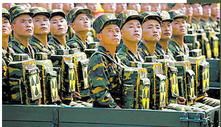
“核背包”的方队在朝鲜阅兵式上