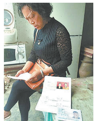
“当事人”闵女士出示结婚手续