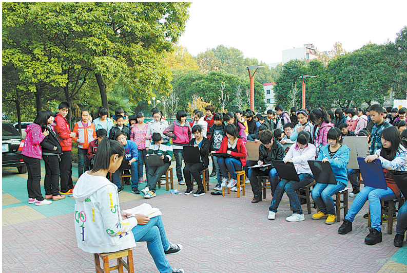
市八中美术课学生写生

5月7日上午,是市八中进行高中招生特长生专业考试的日子,来自平顶山市各初中的1200余名九年级学生或背着画板或携带乐器,陆续走进八中校园,分别参加美术、书法、体育、音乐、播音等专业测试。