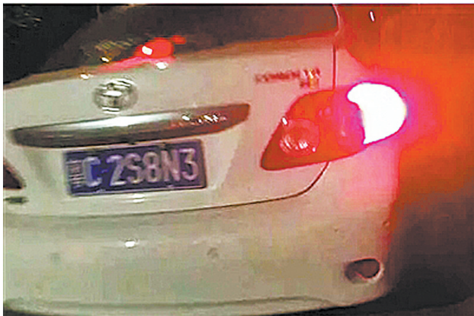
女子上车前发给老公的车牌号码照片

在这一事件中,对于平台的责任,我们绝不推诿。目前我们正在联系乘客家属,我们再次对他们表示歉意和慰问。我们将以最大诚意,全力做好善后,帮助他们渡过难关。