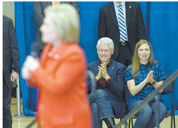
1月30日,在美国艾奥瓦州锡达拉皮兹,民主党总统候选人希拉里·克林顿(前)发表竞选演说,她的丈夫、美国前总统克林顿(前排右二)和女儿切尔西(前排右一)在台下倾听。