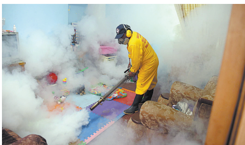
1月29日,在秘鲁利马省,一名工作人员用化学药剂驱蚊。