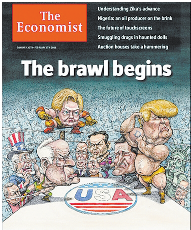
2月1日,2016年美国总统大选正式开打。令人大跌眼镜的是,原本将是克林顿、布什两大家族加冕礼的初选,却不经意让非主流选手抢足了风头。图为最新一期英国《经济学家》杂志封面。

美国2016年总统选举首场预选于2月1日在中西部艾奥瓦州举行。从此开始,十几位竞选人将经历激烈的党内厮杀,最后产生两位候选人,分别代表民主党和共和党角逐总统宝座。