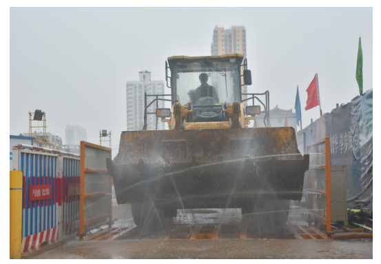
为出场挖掘机“洗淋雨”