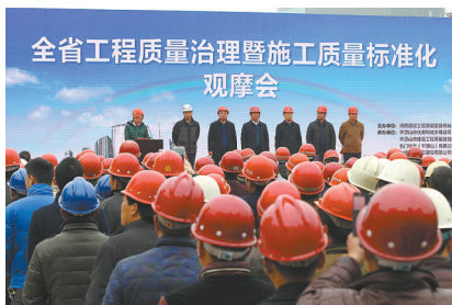
全省工程质量治理暨施工质量标准化观摩会在名门世家项目工地召开