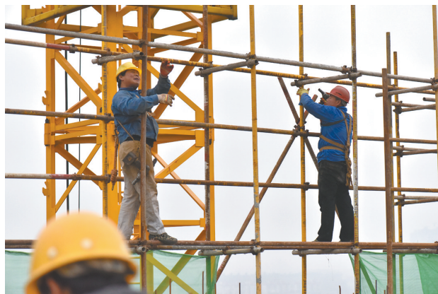
施工人员高空搭建脚手架