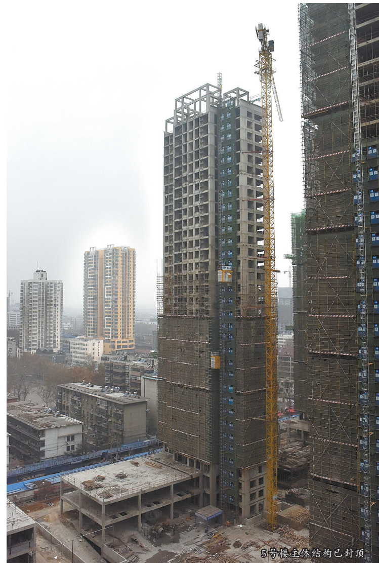
6号楼主体结构已封顶