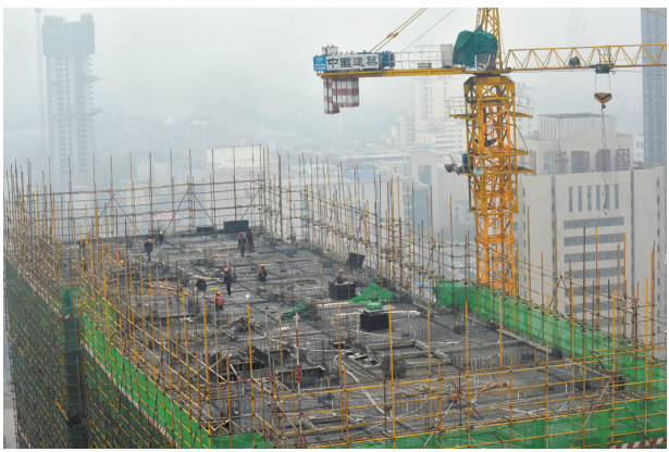
名门9号楼施工至27层