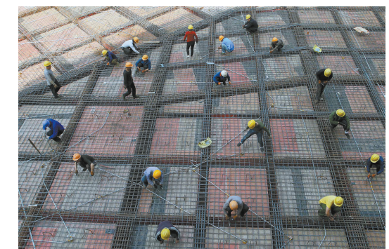
2015年4月29日,施工人员在捆扎钢筋

今年6月14日,作为名门地产2015“关注儿童、关爱未来”活动系列的儿童剧《白雪公主》在平煤神马集团矿工俱乐部上演,近千名鹰城儿童到场观看。“平顶山是一座很有发展前景的城市,我们愿意扎根鹰城,发挥我们在旧城改造方面的资源与管理优势,把鹰城建设得更好,让鹰城的人民过上更美好的生活。”郭勇强表示。