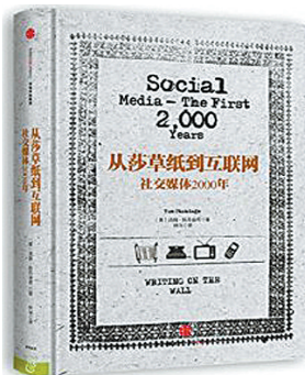
《从莎草纸到互联网：社交媒体2000年》汤姆·斯丹迪奇著，林华译 中信出版集团

显然这是一部有当代问题意识的传播史著作。作者抓住了“社交媒体”这一当代传媒的弄潮儿，将它与“大众媒体”区别开来，并追溯其现代以前的历史。作者认为广播技术的兴起，促成了近代传播的集中，有利于国家对社会和个人的控制，那是“社交媒体的反面”；而互联网技术则扭转了这一情势，使“社交媒体”得以复兴。