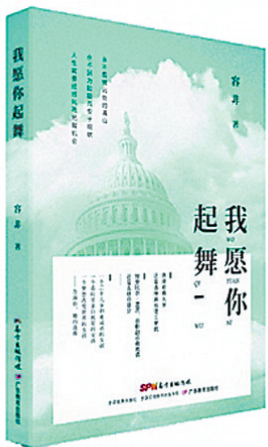
《我愿你起舞》容昕著 广东教育出版社

容昕：我在中国出生和成长的历史使我亲身感受到了中国传统教育方式的博大精深和好处，所以我教育孩子以中国传统方式为主、西方的方式为辅。在我的书里，我提到为了在美国教育好女儿，我曾委托亲友从中国买了一套清朝名臣曾国藩有关家教方面的书，学习、借鉴他的“修身、齐家”理论和方法。(大洋)