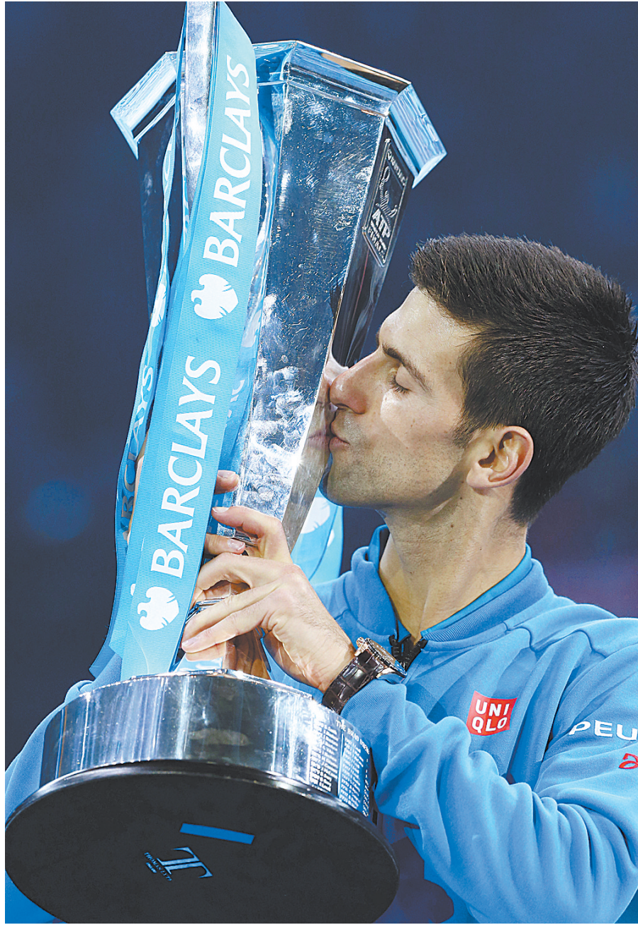
11月22日,德约科维奇在获胜后亲吻奖杯。当日,在英国伦敦进行的2015年ATP世界巡回赛年终总决赛男单决赛中,德约科维奇以2:0战胜费德勒,夺得冠军。

“瑞士天王”赛后说:“没有站在胜利的一边总是让人不爽,但输了也总比去年没有参加比赛强。”