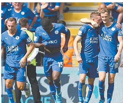
莱切斯特本赛季有了惊人的蜕变

知晓;当然,莱切斯特作为一支小球队能够取得如此成就,足以成为他们的骄傲。此外,莱切斯特的神勇也离不开球员们的爆发,譬如英超当红“炸子鸡”瓦尔迪,最近23场比赛,他参与了22个进球,打入17球助攻5次,本赛季英超联赛打入13球领跑射手榜,连续10轮破门更是追平了曼联名宿范尼创造的跨赛季纪录。