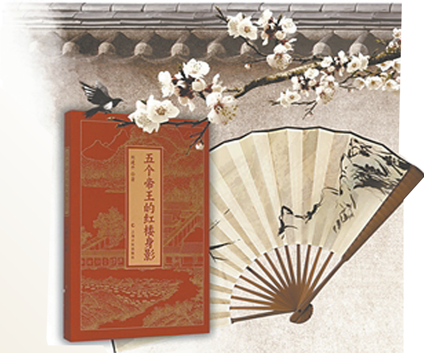
《五个帝王的红楼身影》 刘建平 著 上海文化出版社

转眼四年过去了，二十万字的《五个帝王的红楼身影》书稿又呈现到了眼前。新书主要意思是：《红楼梦》原著中看不到一个帝王，但帝王却无处不在，且是书中的真正主角。《红楼梦》是一本反映康熙与曹家关系的书，更是一本前所未有反省中国五千年历史脉络的文学著作。新书作者的逻辑很简单：曹雪芹家族与清皇室有百年恩怨。在康熙庇护下，曹家从“包衣（奴隶）”很快上升为皇