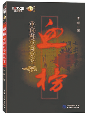
《血榜·中国科举疑案》 李兵 著 中国民主法制出版社

本书选择了从唐朝到清朝的10个典型案例，依据文献进行深入解读案情。“疑案”的产生反映出科举制度背后复杂的势力角逐，钩心斗角。科举是中国古代设科考试，选拔知识分子任官的制度，因此科举与政治、社会密切相关。而统治者在通过对科举考试制度来体现自己意志的同时，还利用一些突发的科场事件，制造一些科举案件，以打击科举舞弊的名义打击对手。这些案件往往在证据链上存在缺失，案情存在诸多疑点，导致这些案件成为疑案、冤案。