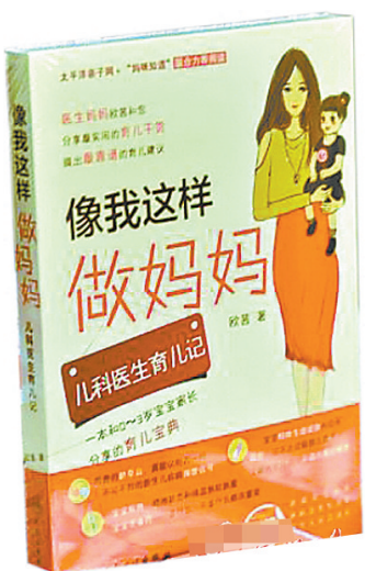
《像我这样做妈妈——儿科医生育儿记》 作者 欧茜 人民卫生出版社

这是欧茜医生结合自己的育儿经历以及近10年儿科工作经验，参考国内外权威育儿理念，整理解答数十万网友育儿疑惑的总结之作。