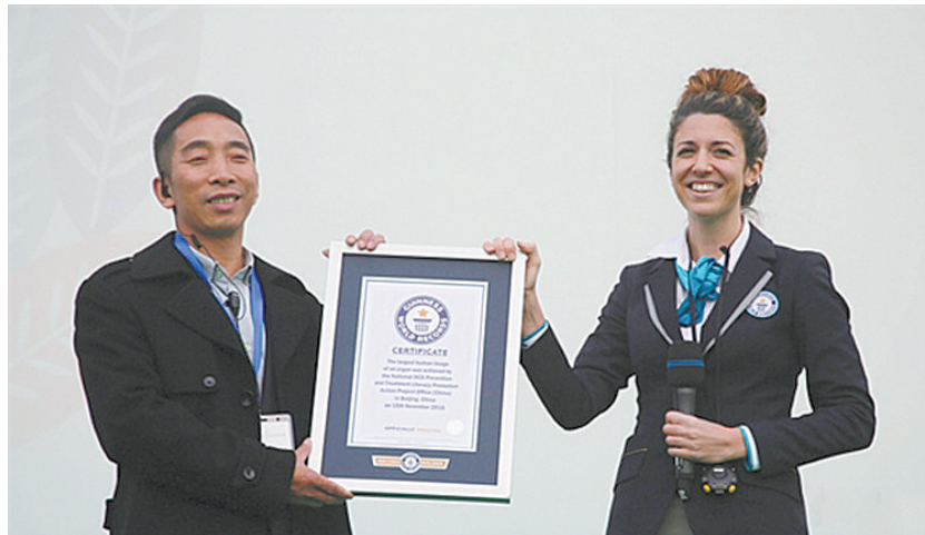
吉尼斯世界纪录认证官宣布挑战成功