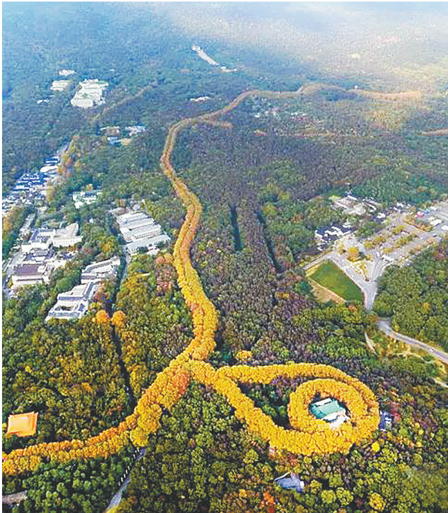
秋天航拍的美龄宫，宛如一条项链吊坠上的宝石（资料图片）。

根据南京出版社《南京地名大全》一书，1984年“美龄宫”三字才正式被收录至地名系统。