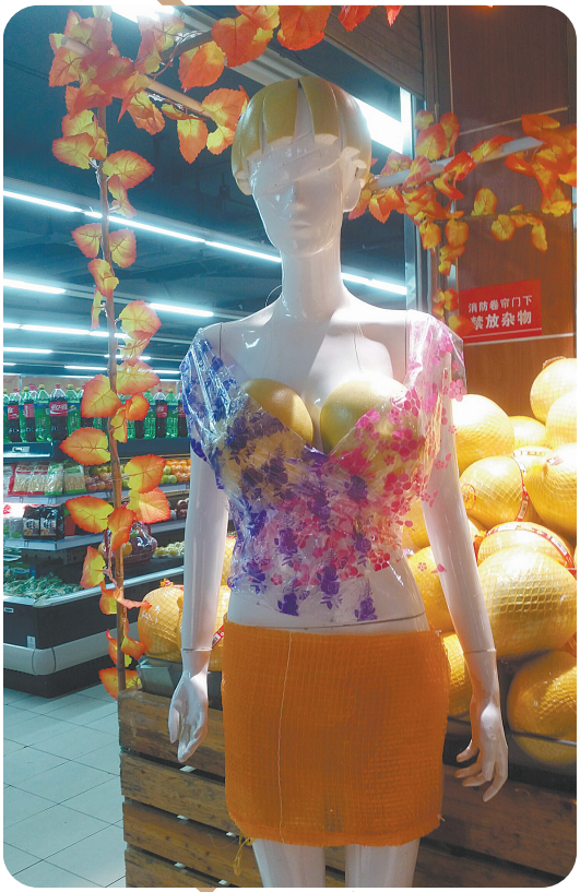
为了卖柚子,超市大妈也是拼了! 生鱼片 11月8日摄于市区体育路某超市

征稿 喜欢“拍客”的朋友,感谢您一直以来的支持。由于没有时间一一回复您的邮件,在此表达歉意。这里重申一下“拍客”照片的宗旨:有趣!希望您多留意生活中搞笑、好玩的瞬间,然后我们选登出来,给大家带去一丝轻松和愉悦。 来照请传到此邮箱: 1725945492@qq.com。照片要清晰,时效性越强越好。还要注明拍摄时间、地点以及您的通信地址。