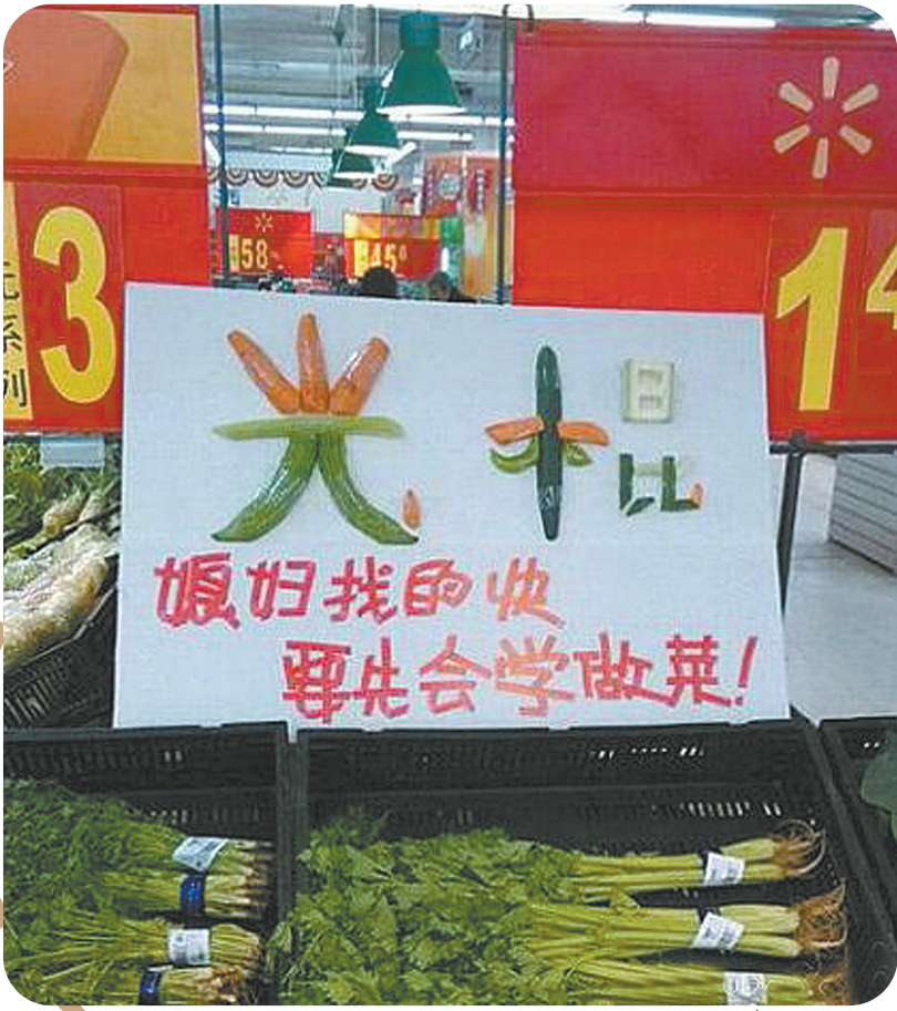
哈哈,想找媳妇,先学会做菜!

征稿 喜欢“拍客”的朋友,感谢您一直以来的支持。由于没有时间一一回复您的邮件,在此表达歉意。这里重申一下“拍客”照片的宗旨:有趣!希望您多留意生活中搞笑、好玩的瞬间,然后我们选登出来,给大家带去一丝轻松和愉悦。 来照请传到此邮箱: 1725945492@qq.com。照片要清晰,时效性越强越好。还要注明拍摄时间、地点以及您的通信地址。