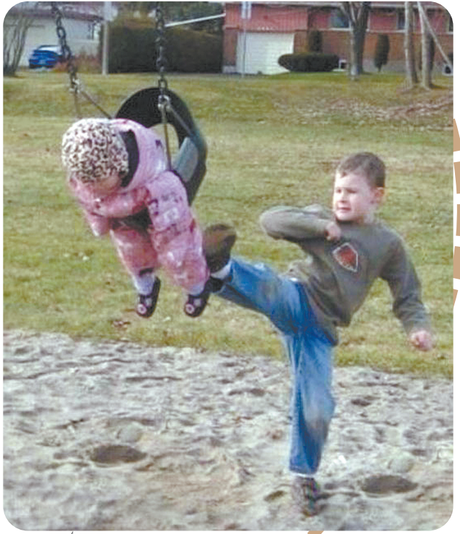
二胎在亲哥哥亲姐 手上的存活率……