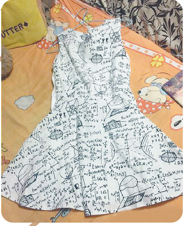
穿这个去考数学,老师你总不能说我作弊吧?!