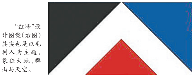
“红峰”设计图案(右图)其实也是以毛利人为主,象征大地、群山与天空。

海选中,代表新西兰强大的眼射激光的几维鸟图案等脑洞大开,让人捧腹的设计方案(下图)统统没有入围。