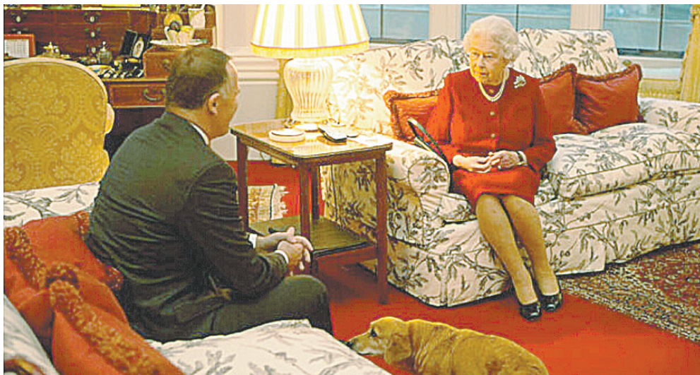
10月31日,新西兰总理约翰·基利用到英国观看橄榄球世界杯决赛的间隙,就即将举行的新西兰更换国旗全民公投向英国女王伊丽莎白二世征求意见(左图)。英国女王表示:换不换随你们便!

新西兰现在的官方国旗从1902年开始使用,至今已超过百年。画面以宝蓝色(Royal Blue)为背景,左上角为英国国旗,右侧为南十字星座的国旗,常常被人误认为是澳大利亚国旗,因为它们长得太像。它们本身的创作过程就存在“撞车”——这两个南半球国家的国旗都选择了南十字星座作为标志,因为南十字星座只能在南半球的夜空被看到;国旗左上角的“米”字旗,