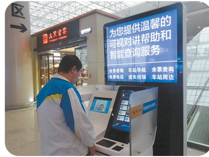
郑州东站的“铁路旅客云服务”系统