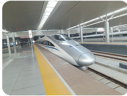
停靠在郑州东站的高铁列车,圆润流畅的车头大气美观

盼望着,盼望着,我省“米”字形高铁西南那一撇,终于破土动工了!从谋划到开工,从蓝图到现实,“米”字形高铁的轮廓日渐清晰。未来的郑州,将再次成为国家高铁干线的中心!这意味着,在郑州坐高铁不只是“走四方”,更是“通八方”。