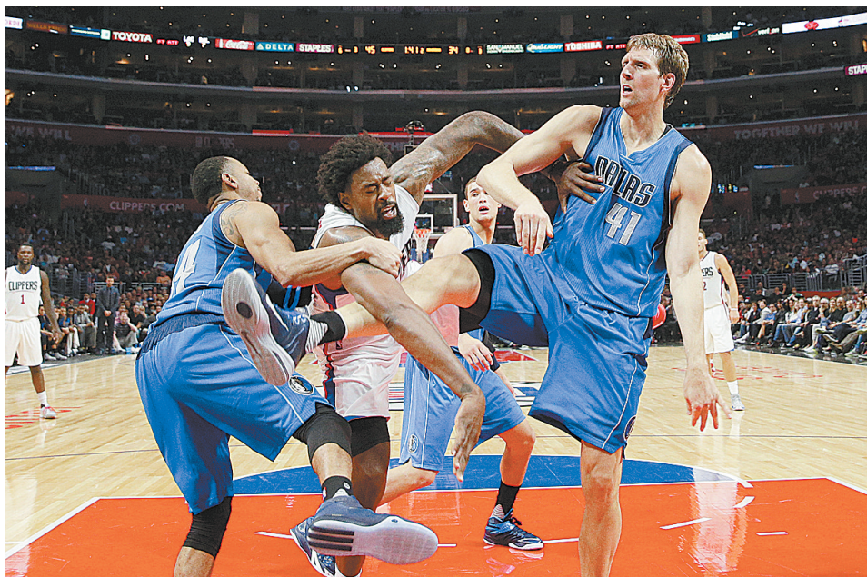
快船队球员德安德烈·乔丹(中)在比赛中遭到小牛队球员诺维茨基(右)和哈里斯夹击。

小牛方面,诺维茨基和詹金斯分别贡献了16分和17分。替补出场的哈里斯和巴里亚各拿到12分。