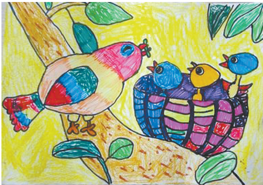
本版图片均为资料图片