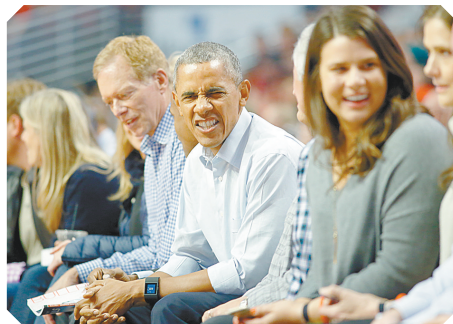
↑10月27日,美国总统奥巴马现场观看芝加哥公牛队与克利夫兰骑士队的比赛。