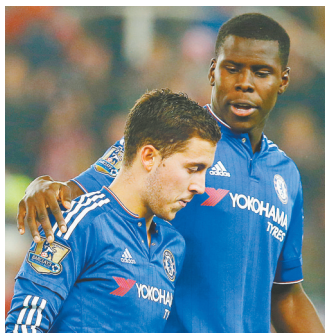
10月27日,切尔西队球员祖马(右)赛后安慰未能罚入点球的队友阿扎尔。