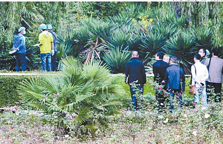
尸体在渭河公园一灌木丛中被发现,警方在勘查现场