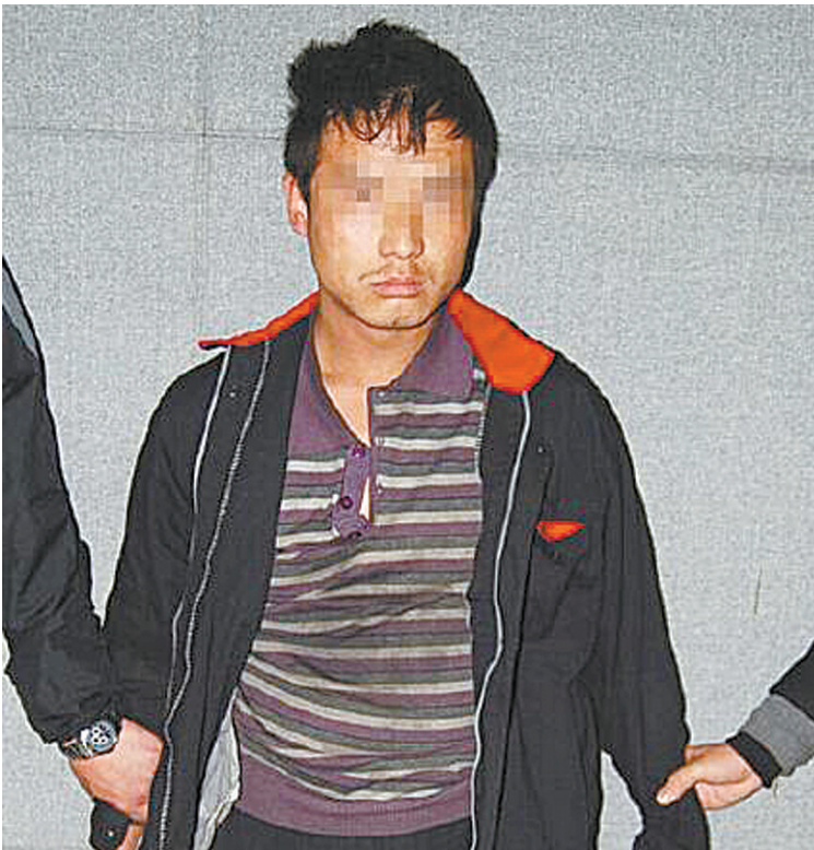
犯罪嫌疑人正面照

公民的权利跟国家机关的权力不同,只要法律没有禁止,公民就可以做,就不违法。而国家机关则必须是法律规定才能做的才能做。所以说公民登这种悬赏通告的通告,绝不违反法律,而且对案件的侦破还有好处。当然如果能与当地公安机关协调好,取得公安机关的同意,由公安机关出面登,会更具权威性,效果也会更好。(宗和)