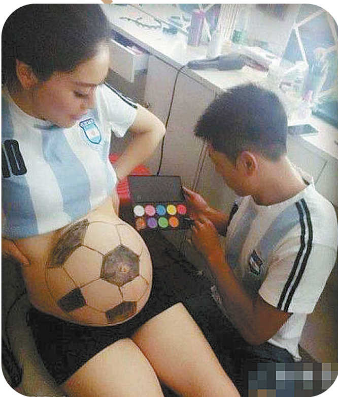
球迷爹妈这么拍孕照

喜欢“拍客”的朋友,感谢您一直以来的支持。由于没有时间一一回复您的邮件,在此表达歉意。这里重申一下“拍客”照片的宗旨:有趣!希望您多留意生活中搞笑、好玩的瞬间,然后我们选登出来,给大家带去一丝轻松和愉悦。 来照请传到此邮箱:1725945492@qq.com。照片要清晰,时效性越强越好。还要注明拍摄时间、地点以及您的通信地址。