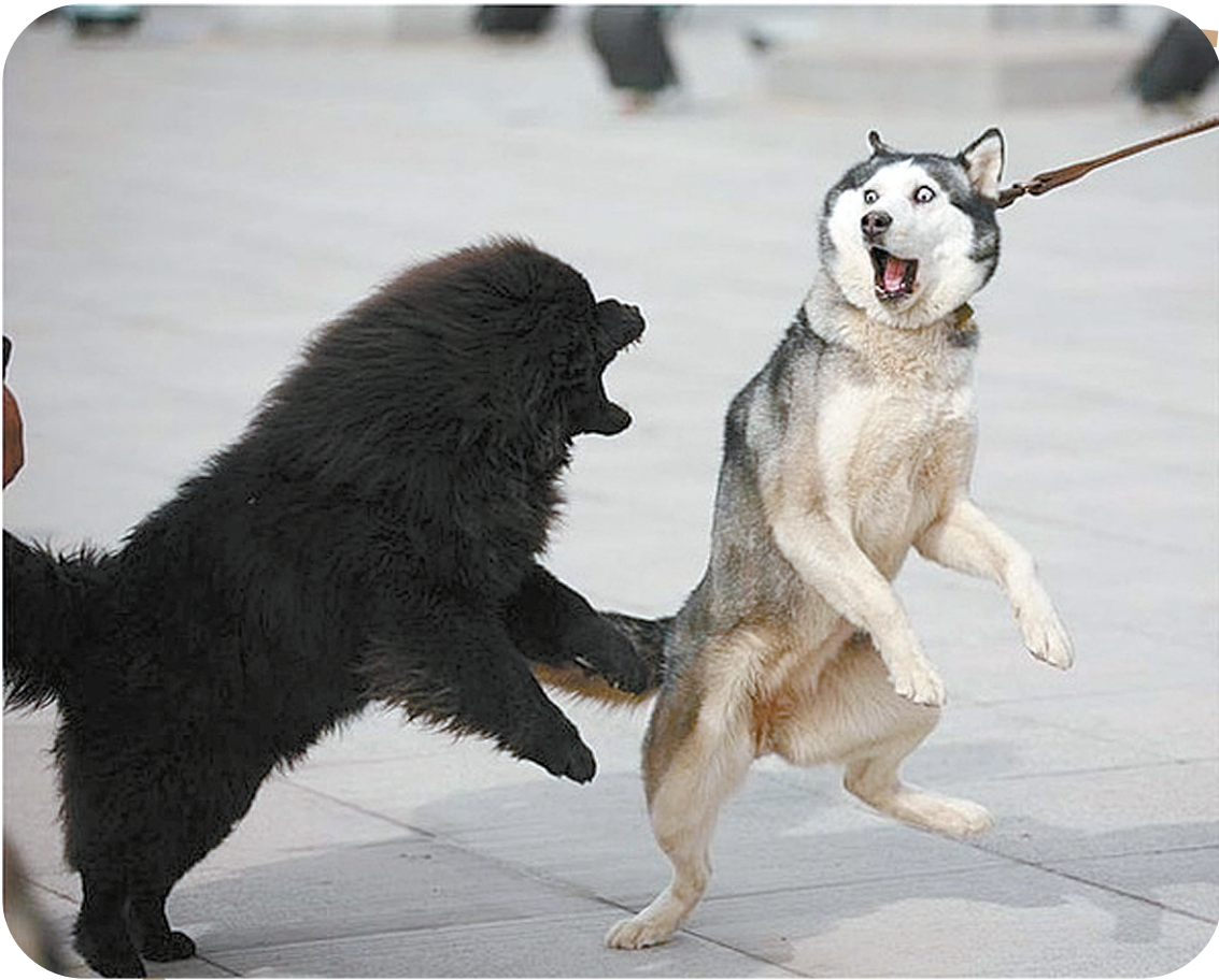
输了气势,却赢了表情