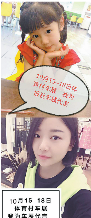
10月15-18日 体育村车展 我为车展代言

注:活动结束后,请参赛人员保持电话畅通。如有疑问请联系微信公众号“鹰城微车市”或拨打15603751862咨询。