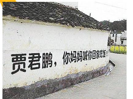
网友恶搞“贾君鹏,你妈妈喊你回家吃饭”。

2009年,有人在网上发帖:“贾君鹏你妈妈喊你回家吃饭”。帖子内容只有“rt”两个字母,意思为“如题”。短短两天回复数30多万,点击数760多万。就在该帖逐渐退烧的时候,北京一传媒公司突然自曝是他们制造了“贾君鹏”,目的是帮助一款游戏保持关注度和人气。据媒体报道,该策划“总计动用网络营销从业人员800余人,注册ID20000余,回复10万余。”这个创意也让他们赚了“6位数”。