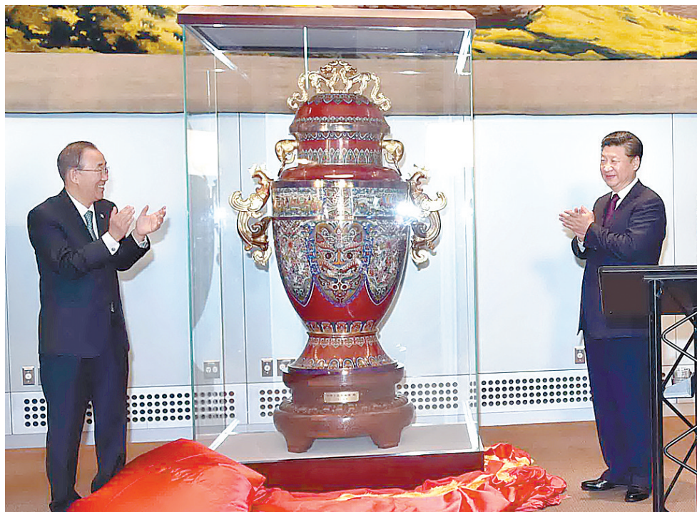
9月27日,国家主席习近平在纽约出席中国向联合国赠送“和平尊”仪式。