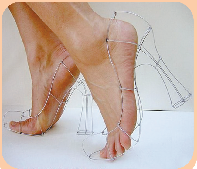
请原谅我不懂时尚