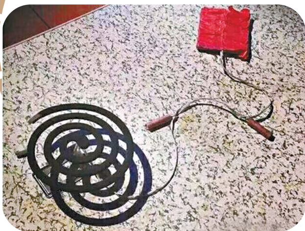
闹钟坏了, 只要用这个代替