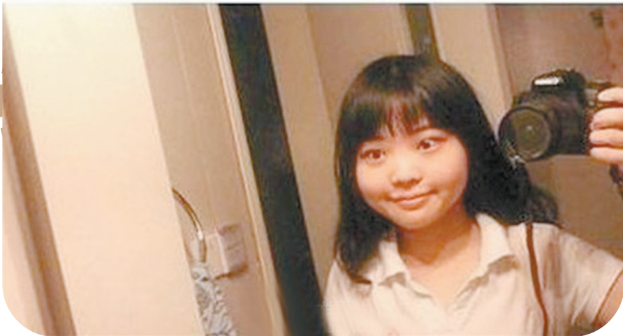
大脸女生的标配发型